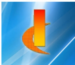
Istituto Comprensivo Statale "G. Murari" Valeggio sul Mincio (VR)