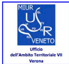
U.S.R. PER IL Veneto Ufficio VII di VERONA